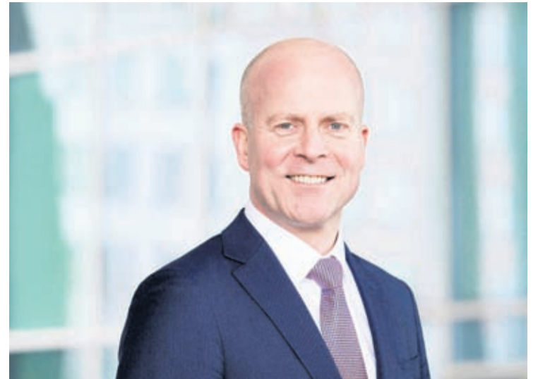
Covid-19 y na Crus Còrà. Lo conclui e bishita na cada isla respectivamente cu un rueda di prensa.

Secretario di Estado lo conclui su bishita na e islanan na Sint Maarten, unda e lo reuni entre otro, cu Gobernador Holiday y Minister-Presidente Jacobs. Tambe tin bishita nan plania na varios empresario y representante di diferente NGO, pa asina papia tocante e experencianan di e aña tras di lomba. Mas aleu, señor Knops lo haci un bishita na e paviljoen nobo di